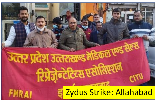
Zydus Strike: Allahabad

Protest Programmes: Albert David, Alkem, AFD, Khandelwal, Zydus Healthcare, Indoco, RPG, Himalaya, JBCPL, Biological E, British Biologicals, Svizera, Wallace, Psychotropics, USV, Shreya, Bal Pharma, Glenmark.