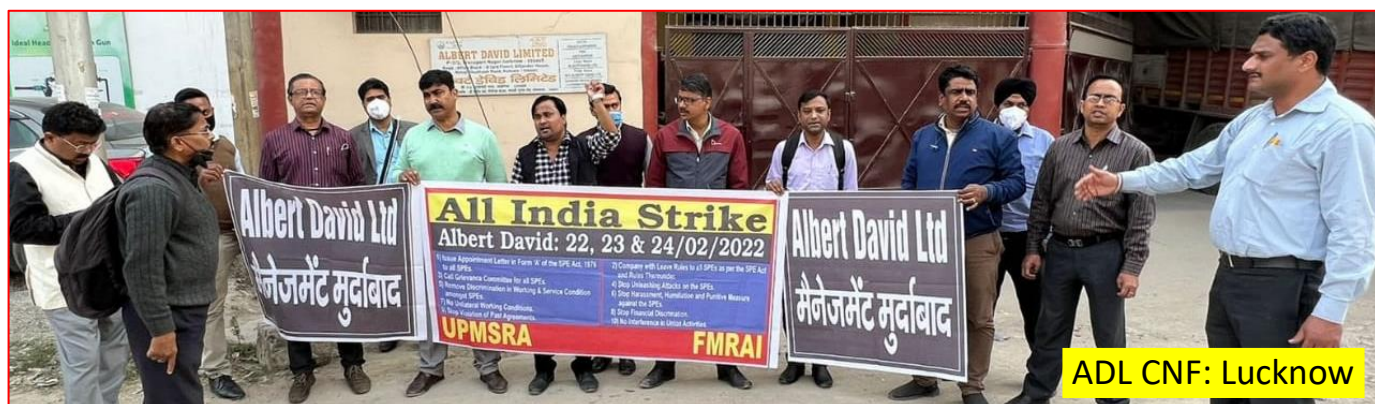
ADL CNF: Lucknow