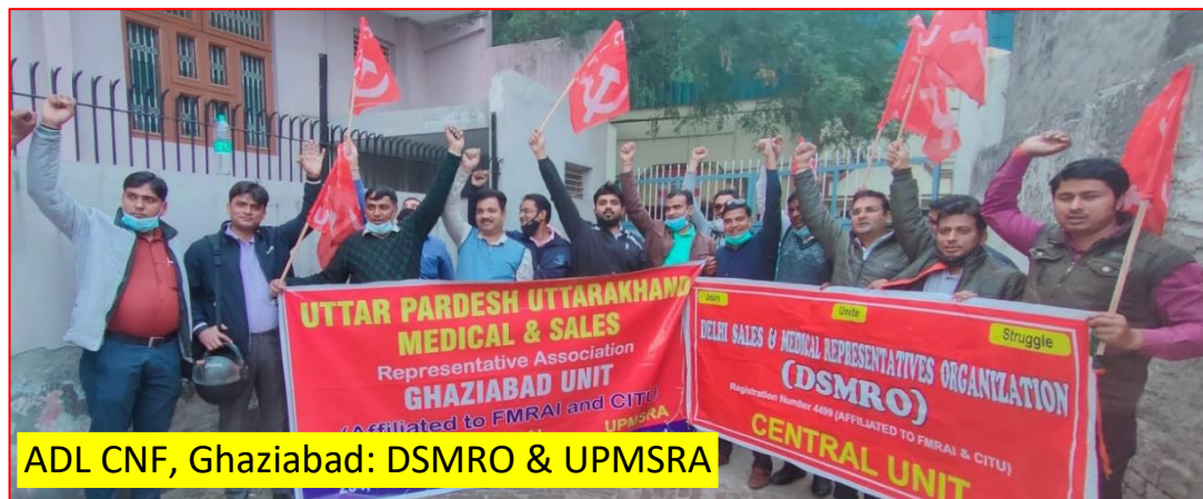
ADL CNF, Ghaziabad: DSMRO & UPMSRA

Councils and Council Sub Committees in UPMSRA are seriously implementing the Council Related Programmes to resist the unlawful acts of the employers. Despite restrictions imposed due to the Pandemic, programmes are implemented following the COVID-19 Protocol.