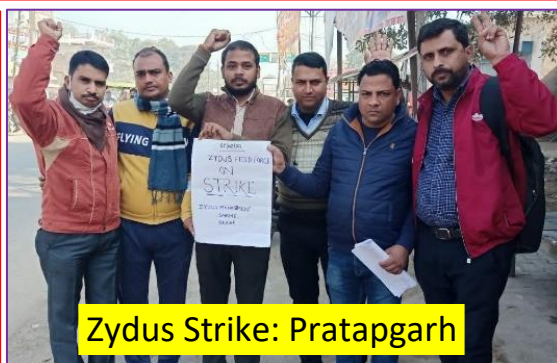
Zydus Strike: Pratapgarh