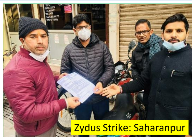
Zydus Strike: Saharanpur