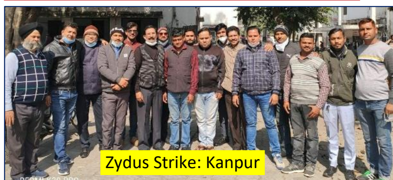
Zydus Strike: Kanpur